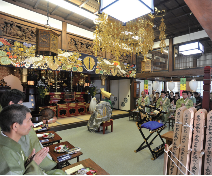
施餓鬼大法要を以前のように行います