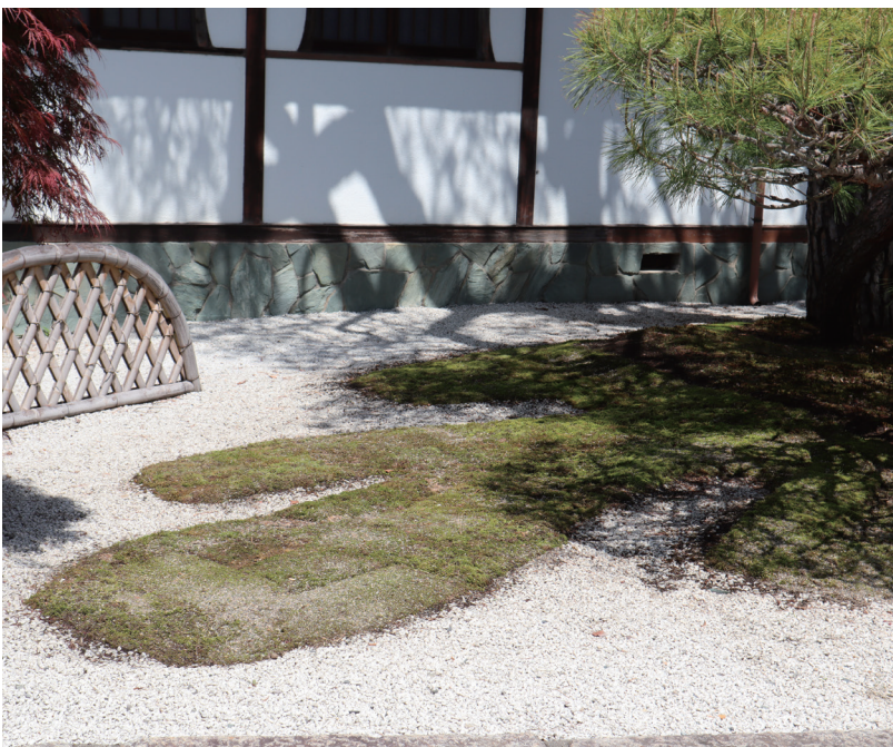
苔を張り替えました

本堂から庫裡の玄関に通じる通路は、法事などで寺に来る際に必ず通る場所です。ここにある松は姿もよいのですが、苔の生育はよくありません。内玄関の側では、築山を平に