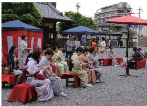
境内で開かれた野点の様子